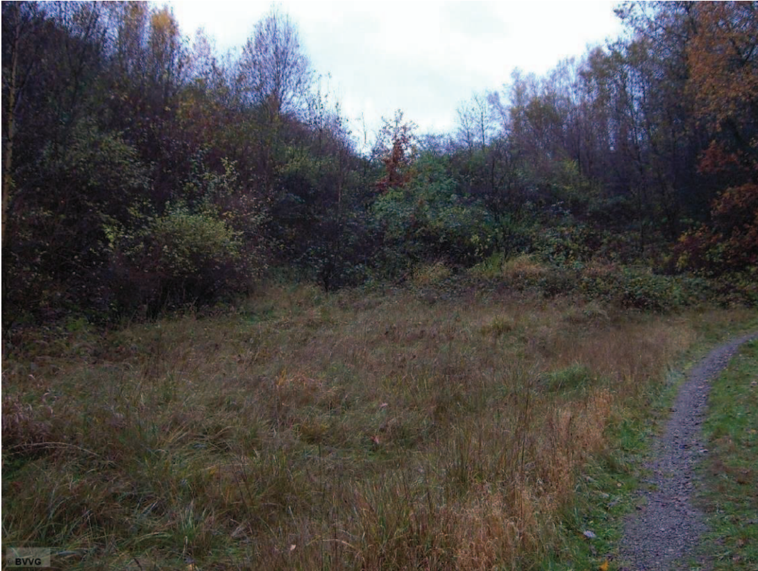
Flst. 651/2 (Stand 14.11.2006)