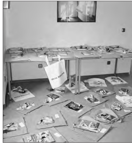
Die Preise im Wert von 400 EUR wurden liebevoll in der Bibliothek verpackt.

Die Bücherei dankt im Namen der Kinder auch den Sponsoren - der Buchhandlung Bücherwurm/Leipzig und der Firma Eisenträger aus Gerstungen für ihre großzügige Unterstützung!