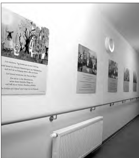
Therapiegang mit Märchen