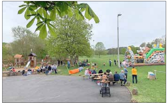
Kinderparcours & Hüpfburg

Vielen Dank an alle Helfer und Unterstützer, die diesen Tag wieder zu einem Highlight im Dorf haben werden lassen. Auch großer Dank an alle Besucher, Zuschauer und Sportler von nah und fern.