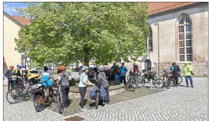
Rast auf dem Marktplatz von Marksuhl mit Radfahrern aus Gerstungen und Werra-Suhl-Tal