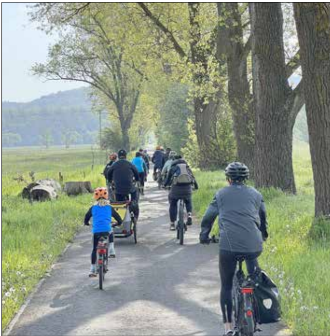
Radfahrer aus Gerstungen auf dem Suhltal-Radweg

Das jährliche Rad-Event der Werra-Wartburgregion ist in diesem Jahr erstmals als Anradeln in Frühjahr gestartet. Bei schönstem Frühlingwetter trafen sich am Samstag 4 Radgruppen in Berka/Werra, Gerstungen, Eisenach und Barchfeld, um mit einer Rad-tour nach Barchfeld-Immelnborn den Frühling sportlich zu begrüßen.