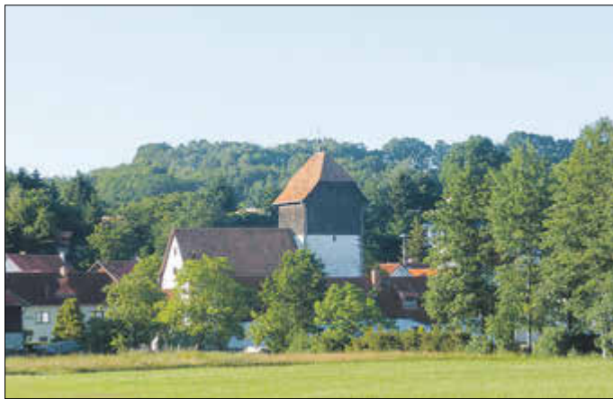
Kirche in Unterellen

11.00 Uhr Gottesdienst / Dreifaltigkeitskirche Unterellen