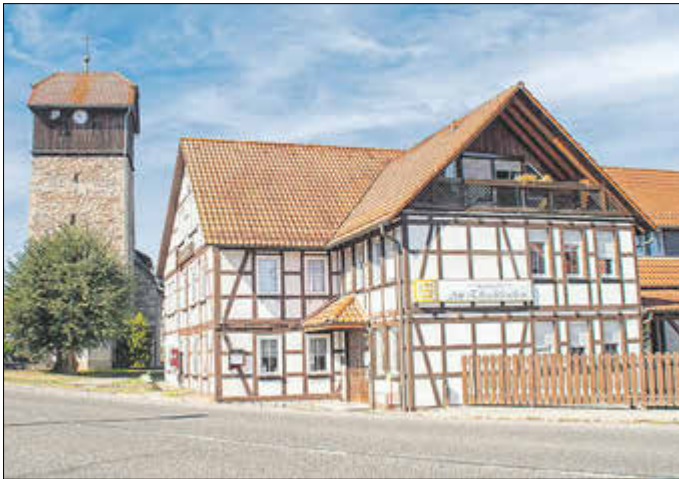
Elteschlösschen in Förtha