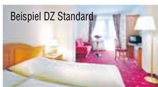
Beispiel DZ Standard