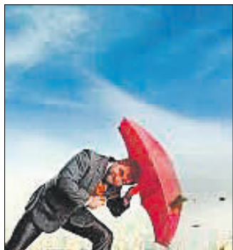
GOTT unscheinbar so unter uns