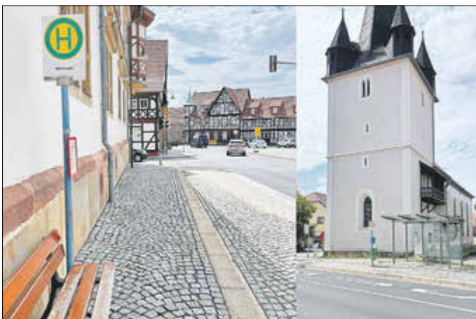
Bushaltestelle (beidseitig) in Marksuhl, Marktplatz

Die Fahrpläne hat Wartburgmobil entsprechend angepasst. Im Hinblick auf die Abfahrzeiten des Schülerbusverkehrs bitten wir um Beachtung!