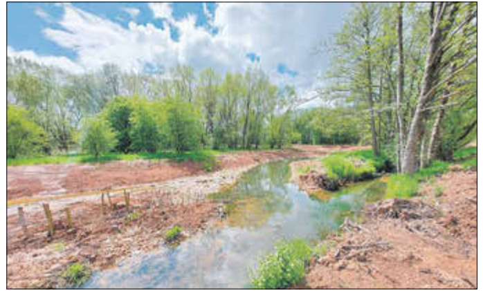
Gerinneverlegung Weihe 2021