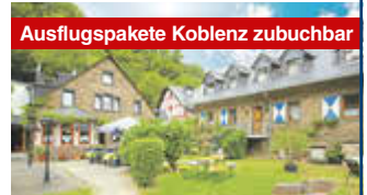
Ausflugs Pakete Koblenz zubuchbar