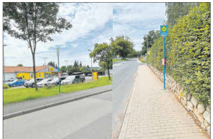
Bushaltestelle (neu, beidseitig) in Marksuhl, Netto-Markt