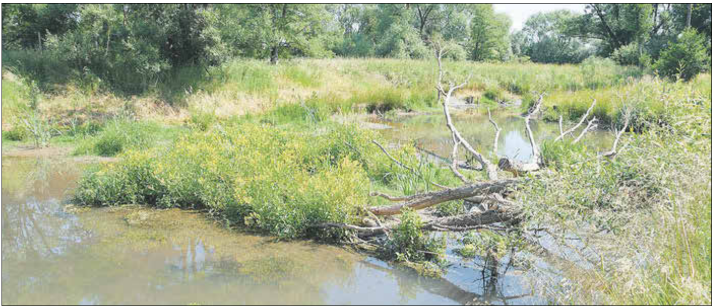
Gerinneverlegung Weihe 2023