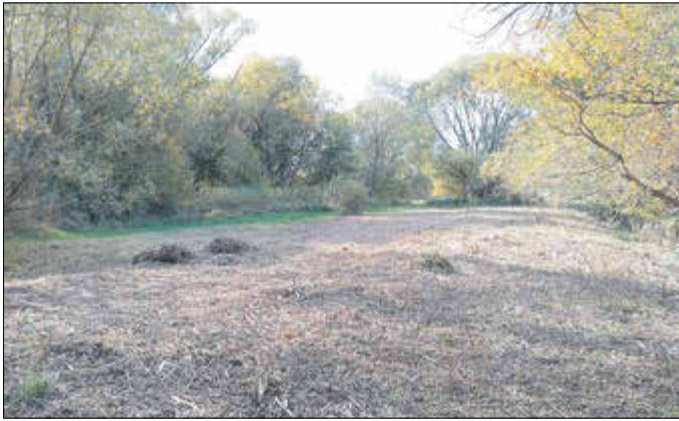
Zustand vor Gerinneverlegung Weihe