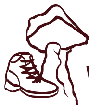
Ausblick Gelersteine-Tour

Tourist-Info-Zentrum Pfälzerwald Schuhmeile 1 · 76846 Hauenstein · Tel. 06392 9233380 www.urlaubsregion-hauenstein.de