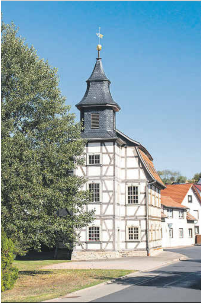
St.-Annen-Kirche in Burkhardtroda