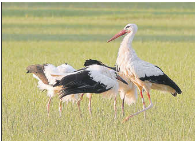
Vater „Franzmann“ der Gerstunger Störche passt auf seinen Nachwuchs auf.

Dennoch konnte man feststellen - wie hier auf den Fotos zu sehen -, dass die Altvögel sich immer noch um die Nahrungsbeschaffung sorgen.