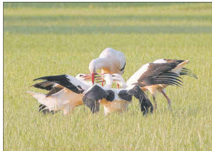
Immer noch gerne nehmen die Jungspunde mitgebrachte Nahrung der Altvögel an.