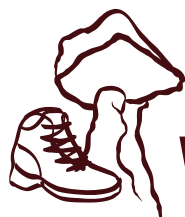
Ausblick Gelersteine-Tour

Tourist-Info-Zentrum Pfälzerwald Schuhmeile 1 · 76846 Hauenstein · Tel. 06392 9233380 www.urlaubsregion-hauenstein.de