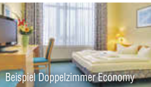
Beispiel Doppelzimmer Economy