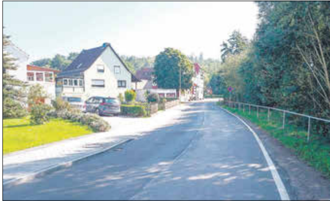
Alte Bahnhofstraße in Wolfsburg-Unkeroda nach Beendigung der Bauarbeiten Anfang September 2023

Nach etwa einem halben Jahr Bauzeit wurden umfangreiche Bauarbeiten für die Verlegung von Trinkwasserleitungen vom Ortsausgang Förtha in Richtung Wolfsburg-Unkeroda (bis zur Einmündung Struth) sowie die zeitgleiche Sanierung des Gehweges in der „Alten Bahnhofstraße“ abgeschlossen.