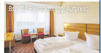
Bsp. DZ Panorama (gg. Aufpreis)

Preise ggf. zzgl. Wochenendzuschlag Einzelzimmerzuschlag: 20 €/Nacht Kurtaxe: ca. 2,10 € p. P./Nacht Auch 7 Nächte buchbar. Weitere Termine 2024 buchbar.