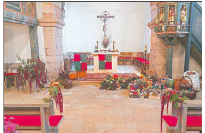
Erntedank in Oberellen