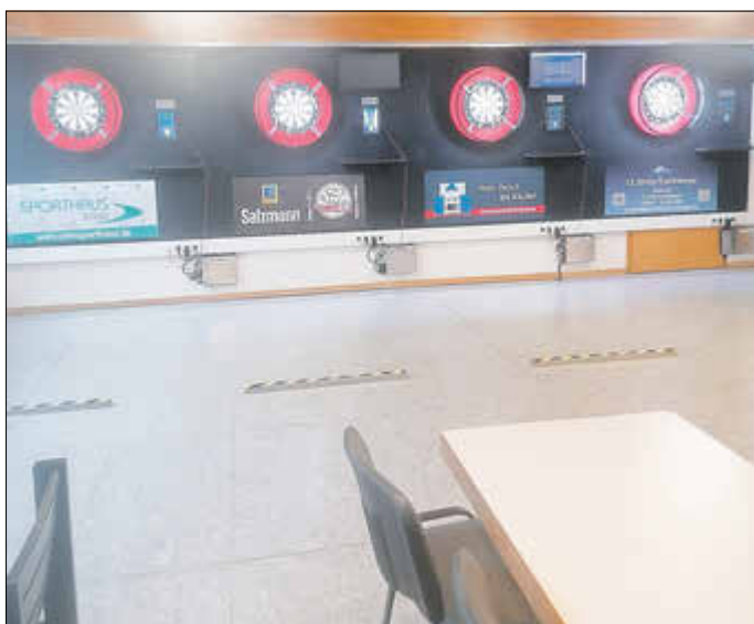
Schöne Anlage der Husarendarter Sontra.