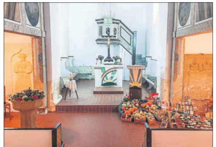
Erntedank in Unterellen