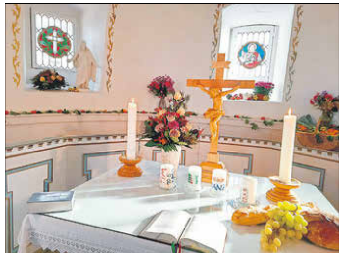
Erntedank in Untersuhl

Büro unserer Kirchengemeinden An der Kirche 6, 99834 Gerstungen