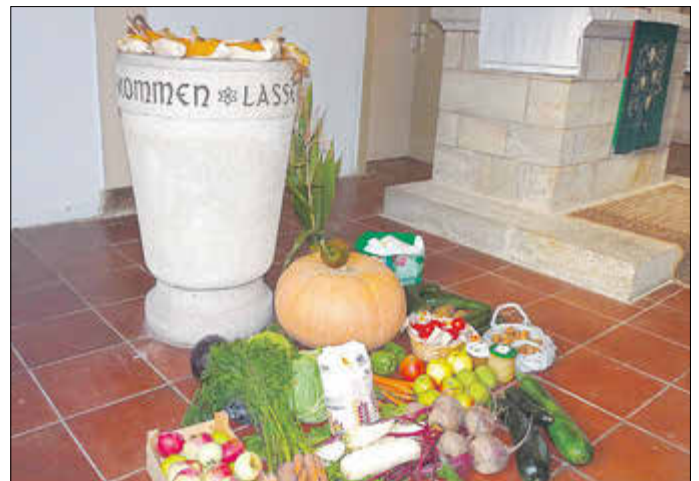
Erntedankfest in Burkhardtroda

Erntedank: „Es geht durch unsre Hände, kommt aber her von Gott: Alle gute Gabe kommt her von Gott, dem Herrn, drum dankt ihm, dankt und hofft auf ihn.“