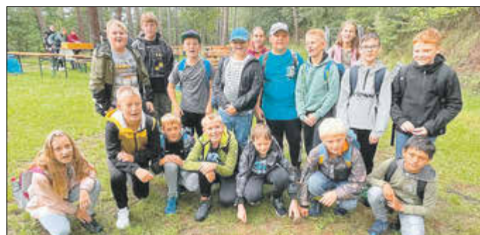
Klasse 5b: Herzlichen Glückwunsch an die Sieger der diesjährigen Waldrallye!

Das Team der Eichelbergschule bedankt sich bei allen Partnern und Mitwirkenden der diesjährigen Waldrallye und freut sich bereits jetzt auf die erneute Durchführung im kommenden Jahr.