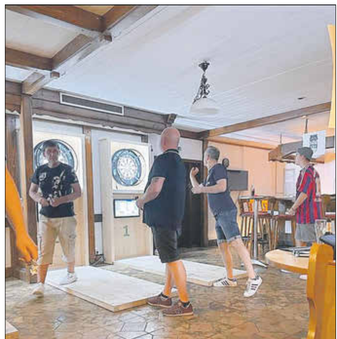
ESV zu Gast in Herleshausen