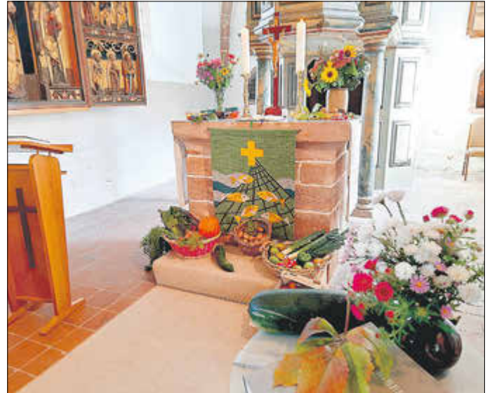
Erntedank in Sallmannshausen