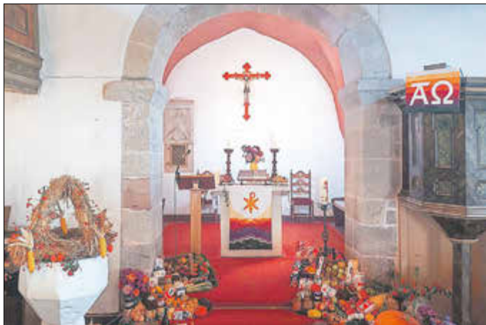
Erntedank in Förtha