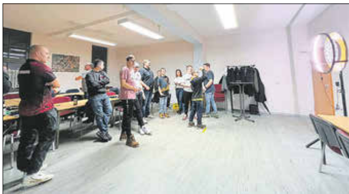
Die ersten Darts fliegen zur Gründungsversammlung.

Am 17.02.2023 wurde in der „Alten Schule“ in Untersuhl die jüngste Abteilung des ESV Gerstungen gegründet. Seitdem bereichert nun Darts die sportliche Vielfalt in unserem Ort. Zu unserer Gründungsversammlung erschienen 23 Männer, Frauen sowie Jugendliche Dartfreunde, von denen 18 unsere Ausführungen so überzeugend fanden, dass sie in die Abteilung Darts eingetreten sind. Sehr erfreulich ist hierbei, dass der ESV 10 Neuanmeldungen für den Verein verbuchen konnte.