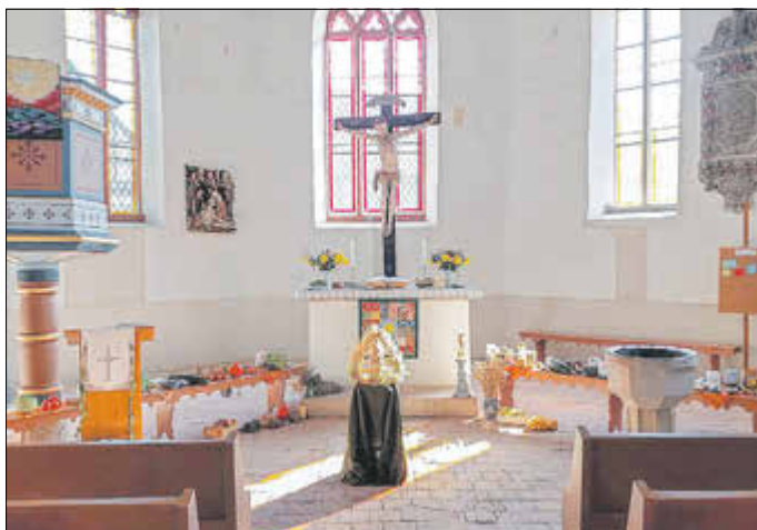
Erntedank in Lauchröden