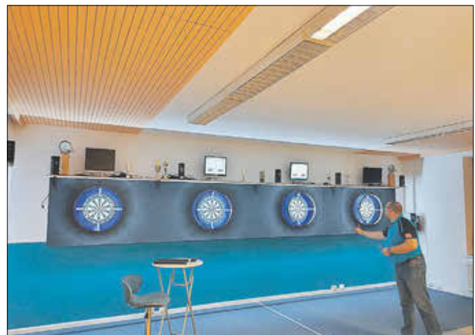
Anlage in Kleinensee

ESV 1 & 2 - SpFr Kleinensee 1 & 24-8 (erste Wettkampferfahrungen für die meisten ESV Spieler, die Aufregung war zu groß)