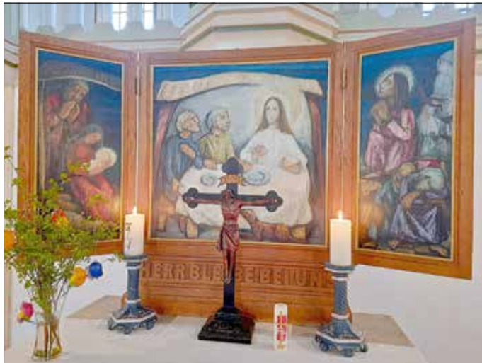
Altar in Burkhardtroda

An Ostern läuteten auch in Burkhardtroda die Kirchenglocken und versammelte sich die christliche Gemeinde. Die elegante Fachwerkkirche St. Anna entstand 1787. Den Altar ziert ein Triptychon von Lisa Beyer-Jatzlau. Die Mitteltafel stellt zwei Jünger bei der Begegnung mit dem auferstandenen Christus in Emmaus dar mit dem Schriftzug: Herr bleibe bei uns. Als sie gemeinsam speisten erkannten sie Christus erst. Das Gemälde erinnert die Gemeindeglieder daran, dass Jesus beim Abendmahl unter ihnen weilt. Der linke Altarflügel erzählt von der Geburt Christi, der rechte Flügel zeigt Jesus im Garten Gethsemane.