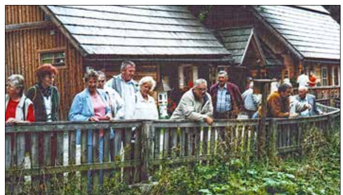
Besuch des Öko-Parkes Hochreiter