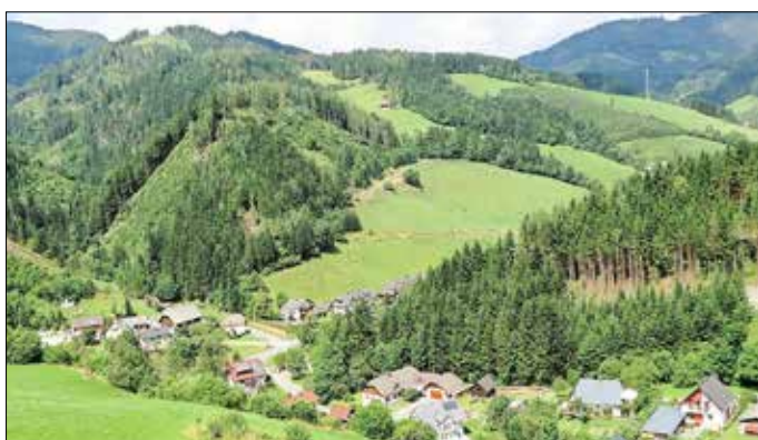
Breitenau am Hochtlantsch