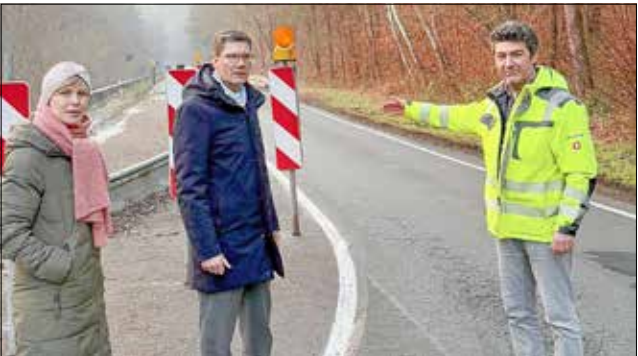
Vort-Ort-Termin auf der Trasse

Udo Schilling, Erster Beigeordneter des Wartburgkreises, wird das Thema bei den turnusmäßigen Beratungen mit dem Thüringer Ministerium für Digitales und Infrastruktur auf den Tisch bringen.