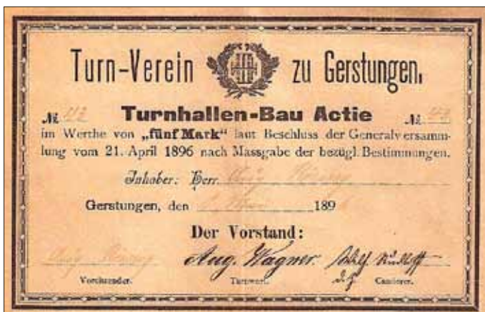
So kam es am 14. Juni 1896 zur Einweihung der Turnhalle (Bild 3)

Ein Turnhallenbau für die Gerstunger Sportler wurde ins Auge gefasst. Der Gastwirt Schalles überließ ein Gartengrundstück und schoss 1500 Mark Bausumme vor. Dafür verpflichtete sich der Verein diese Gaststätte als Vereinslokal zu nutzen und Festlichkeiten hier abzuhalten. Da die Bausumme nicht reichte, wurde der Rest durch die Turnhallen-Bau Actie finanziert.