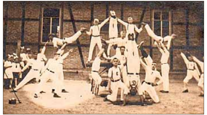
Hier sehen wir im Hintergrund die Turnhalle und eine Pyramidengruppe.