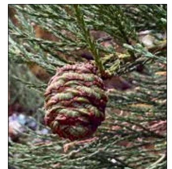
Zapfen des Mammutbaums, ihre winzigen Samen sind zur Keimung auf Bodenfeuer angewiesen