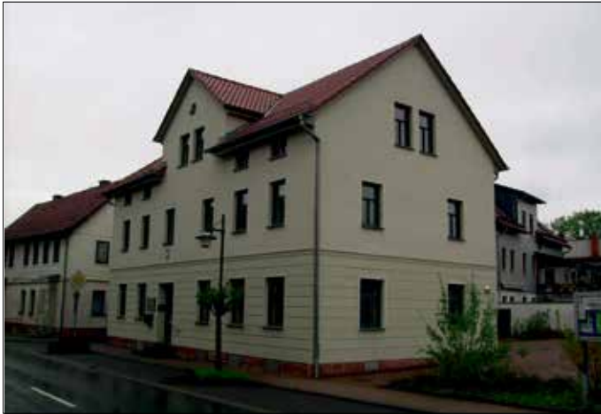
Bürogebäude der Gemeindewerke Gerstungen

Die Gemeindewerke Gerstungen haben ihren Sitz in der Wilhelmstraße 45 in Gerstungen und beschäftigen zurzeit 16 Mitarbeiter.