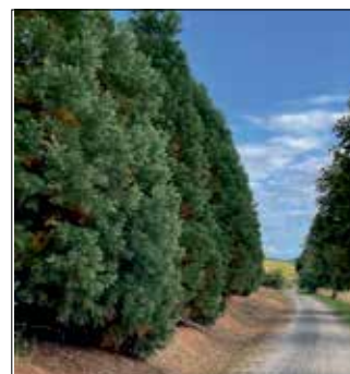
Sandweg Richtung Oberellen