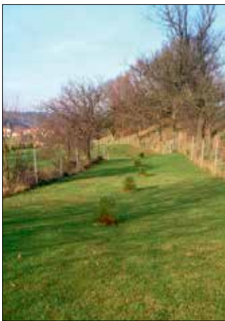
Anpflanzungen im März/April 2013

Auch in Europa erreichen die ältesten, inzwischen etwa gut einhundertjährigen Mammutbäume fast 50 m Höhe. In milden Lagen West- und Süddeutschlands, aber auch bei Mönchengladbach und auf dem Riensberger Friedhof in Bremen, ist der Mammutbaum ein häufiger, sehr ansehnlicher Parkbaum. Ein besonders eindrucksvoller und leistungsfähiger Bestand befindet sich in Weinheim/Bergstraße. Die beschädigten Zweige sollen zerreiben einen intensiven Anisgeruch verbreiten. Mammutbäume fühlen sich in der Stadtluft nicht besonders wohl. Ganz anders als am Rande eines kleinen Dorfes im westlichen Wartburgkreis, im Elletal, scheinen die Riesenbäume der kleinen Baumkolonie ähnliche Bedingungen wie in ihrer amerikanischen Ursprungsheimat vorzufinden.