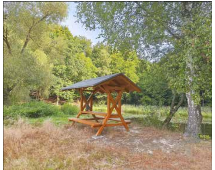
Sitzgelegenheit am Jägersteich

(bestehend aus Vertretern vieler Marksuhler Vereine)