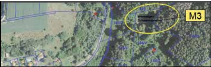
Lageplan der Maßnahme M3 (Darstellung unmaßstäblich und symbolhaft)

Der Entwurf des vorhabenbezogenen Bebauungsplanes Windpark Gerstungen-Ost, bestehend aus der Planzeichnung und der Begründung, Stand Juli 2025, wird im Zeitraum