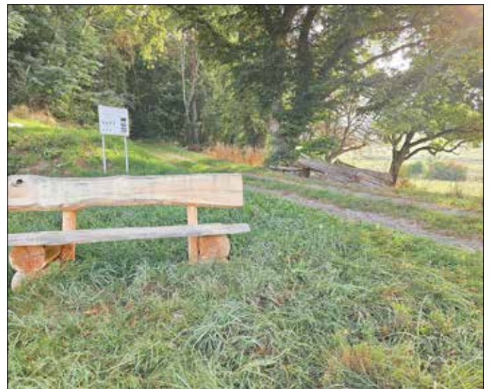
Bank im Bohngartental