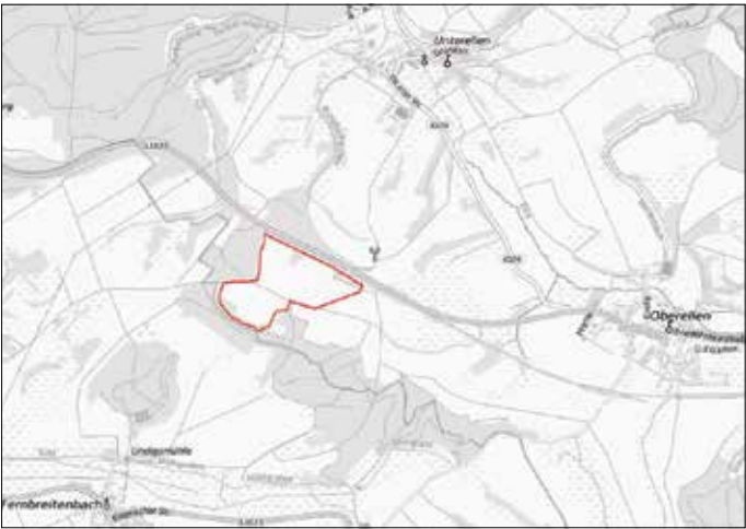
Geltungsbereich - unmaßstäblich

Für den räumlichen Geltungsbereich des Bebauungsplans ist der nachfolgende Lageplan maßgebend.