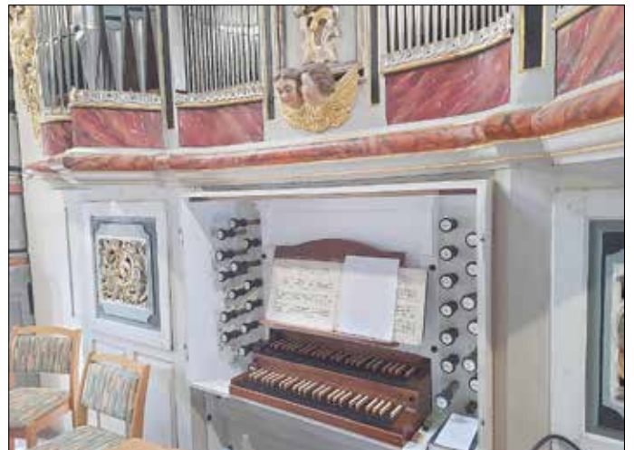
Orgel Hubertuskirche Marksuhl

Alle Chorsänger 10:30 und Bläser 12:00 der Region sind am Vormittag zu Proben ins Gemeindehaus Marksuhl und dann zur Mitwirkung im Gottesdienst eingeladen;