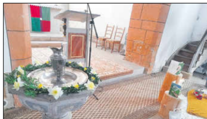
Taufe an Ostern in der Hubertuskirche Marksuhl

Vier Täuflinge im Alter von eins, zwei, 14 und 24 Jahren vertrauten sich aus unseren Gemeinden an Ostern der Liebe Gottes in der Gemeinschaft der Christenmenschen an. In der Osternacht gestalteten der Kirchenchor Wünschensuhl und elf Ehrenamtliche darunter vier Konfis die fünf Stationen. Besucherinnen ließen sich mit dem Taufwasser auf dem Handrücken österlich segnen unter dem Bibelwort: Ich will dich segnen und du sollst ein Segen sein. Anschließend gab es Begegnungen und Gespräche zum „Fastenbrechen“ in der kleinen Kirche und am Feuerkorb der FFW. Das Heilige Abendmahl wurde am Karfreitag verschiedentlich gefeiert. An kirchlich Bestattete wurden fürbittend im Kreise der Angehörigen erinnert. Unsere acht Kirchen und zwei Pflegeheime waren in diesen Tagen liebevoll vorbereitet und geschmückt. Danke für das Dabeisein und Mittun! Denn Ostern erinnert uns: „Es hat schon begonnen, gut zu werden.“ Nichts und niemand kann diese Dynamik trotz allem aufhalten.