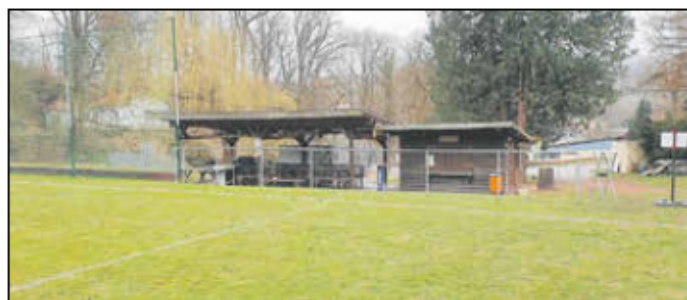
Bauprojekt Stand jetzt