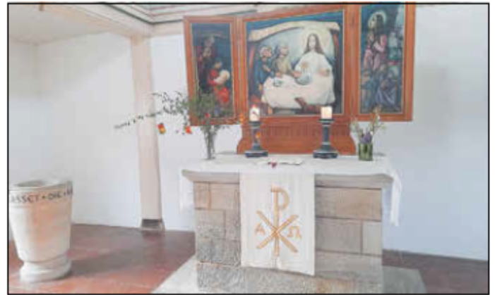
Altar in der Annenkirche Burkhardtroda: Osterbild „Emmausjünger“, und österliches Parament (Altartuch)

Unsere Evangelischen Kirchengemeinden Gerstungen, Neustädt-Sallmannshausen und Untersuhl; sowie in der Vakanz Burkhardtroda, Fernbreitenbach, Marksuhl und Wünschensuhl