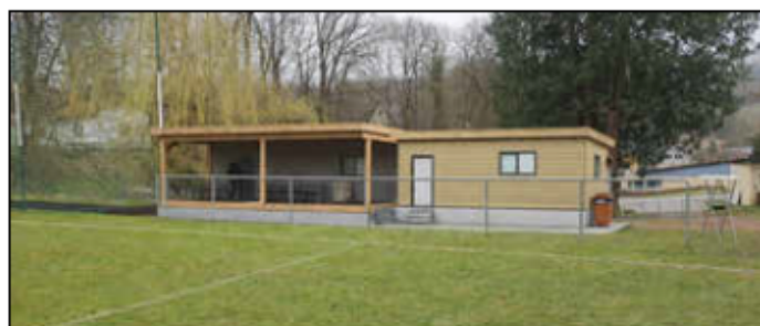
Bauprojekt - wie es im fertigen Zustand aussehen könnte (KI generiert)