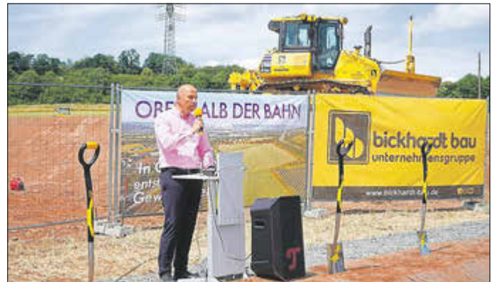
„Spatenstich“ im Gewerbegebiet „Oberhalb der Bahn“ vom Juni 2025

Die Errichtung des Gewerbegebietes „Oberhalb der Bahn“ ist für die Gesamtentwicklung und Einnahmensicherung der Gemeinde von enormer Relevanz.