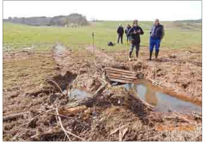
Tiefe Spuren wurden von den Tätern hinterlassen, welche mit offenbar schwerem Räumgerät den Biberdamm beschädigten und geöffnet hatten.

Breite Reifenspuren waren noch erkennbar. Beim weiteren Begehen des Flusses in Richtung Unterellen konnte kein weiterer Damm mehr gefunden werden. Der vorhandene Bau war nicht mehr bewohnt und der ehemals unter Wasser gelegene Zugang trockengelegt.