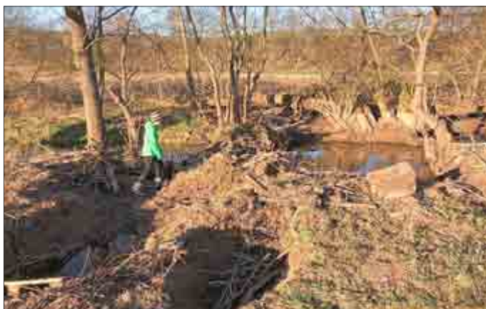
Zerstörter Damm in der Elte, der abgesenkte Wasserspiegel von circa 1,0m ist rechts deutlich erkennbar.