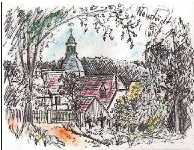
Die Kirche von Neustädt vom Friedhof aus gesehen.