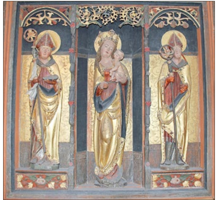
Der Schnitzaltar in der Sallmannshäuser Kirche, restauriert, betont goldfarben. Einen geschnitzten Altar haben auch die Kirchen von Herda und Lauchröden. In allen drei Dörfern hatten die adligen Familien von Herda Besitz und hoheitliche Befugnisse. Diese dürften als Stifter in Frage kommen. Eine vergleichende Betrachtung wäre aufschlussreich.