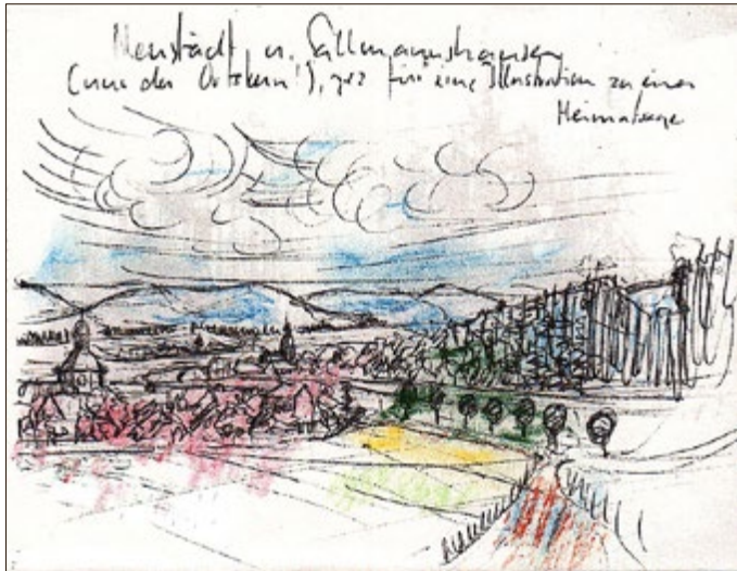
Historische skizzenhafte Ansicht des Pfortenpaares Neustädt / Sallmannshausen. Die Feldstraße gab es noch nicht.