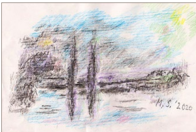
Das vom Wehr gestaute Wasser der Werra vor Sallmannshausen, Bleistiftzeichnung, leicht coloriert, eine beachtlich große Fläche einnehmend.