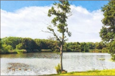
Werraaltarm - Baggerloch bei Untersuhl