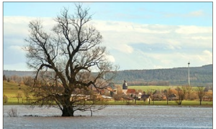
Blick nach Herda mit Margarethenkirche

Und endlich die Margarethenkirche in Herda , zweigliedrig der Baukörper - mit Turm und Schiff. Der Turm ist nach oben abgeschlossen durch eine bereits erwähnte beeindruckende welsche Haube, kreisrund auf großem Durchmesser. Zudem steigert der aktuelle frische Farbanstrich in Rot und Weiß die optische Wirkung. Die Goethe- und die Schillerstraße, sowie die Lutherstraße in Gerstungen sind auf den Herdaer Kirchturm gerichtet.