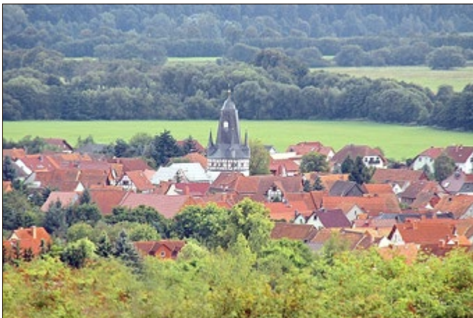
Kirche Untersuhl auf einer Terrasse über der Werraue, sicher vor dem Hochwasser

Architekturdominanten umrahmen das Tal. Es sind dies Schloss und Katharinenkirche Gerstungen , die pittoreske Krone des Ortes, den Turm der letzteren zierte eine Schweifkuppel mit Laterne, in der Fachsprache „Welsche Haube“ genannt.