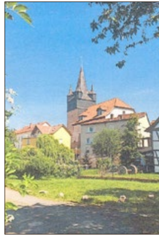
Kirche, Turmhelm mit Auslug nach 4 Seiten

Weiter die Rundkirche Untersuhl , ein hoch aufragendes Bauwerk mit Filialtürmen und Rokoko-Turmhelm, unten Kirche, oben Wegwarte für wichtige Handelsstraßen nach Nürnberg, Bremen, Leipzig und Frankfurt, sodann die Laurentiuskirche in Berka .