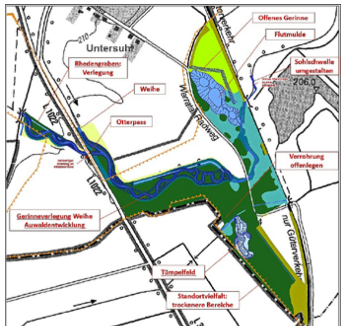
Baufeld mit Maßnahmenelementen der Renaturierung und naturschutzfachlichen Aufwertung. Plan: Maßnahmenziele, Verfasser: Christoph Altmannshofer, emc GmbH, Grundlagen: Entwurfs- und Genehmigungplanung, Hydroprojekt Ingenieurgesellschaft mbH und DTK10, TLVermGeo.