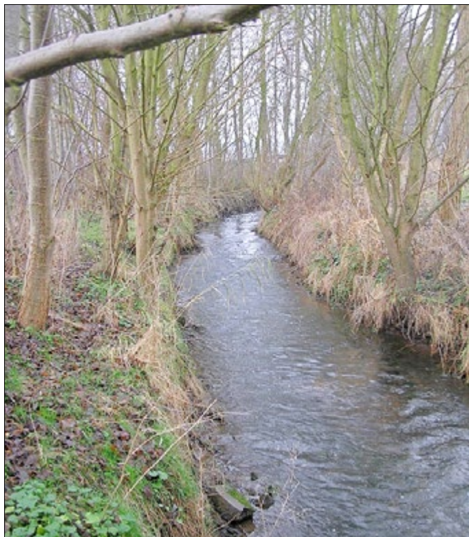
Die strukturarme Weihe: Querschnitt und Tiefe sind einheitlich, die Ufer steil und teilw. befestigt.

Zunächst beginnt die Baufeldfreimachung durch Mahd der Wiesen und Böschungen mit simultaner Begleitung des Kampfmittelräumdienstes auf dem ehemaligen Grenzgebiet. Das Baufeld wird dann mit Amphibienleiteinrichtungen ausgestattet. Ab September sind Baumfällungen und anschließend die Hauptbaumaßnahme zur Umgestaltung der zu renaturierenden Bereiche vorgesehen. Die Baumaßnahmen im FFH-Gebiet sollen im Februar 2021 abgeschlossen werden.