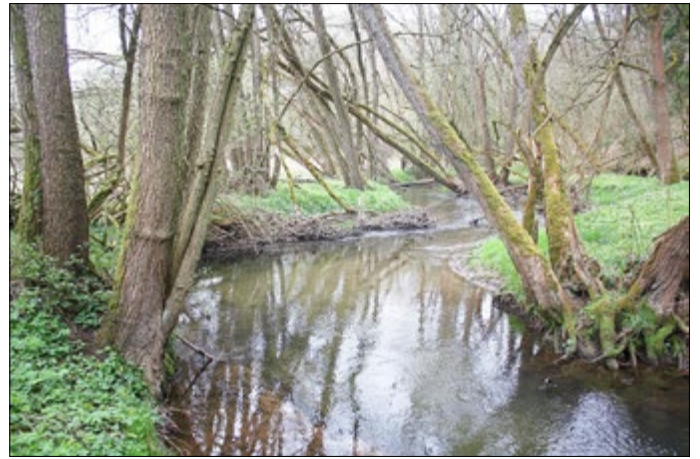
Zielzustand: Richtungsänderungen, Varianz von Tiefe, Breite und Fließgeschwindigkeit, Varianz der Steilheit der Uferböschungen, Entwicklungskorridor für Laufveränderungen.